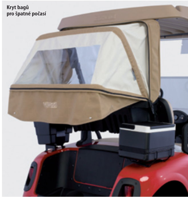
Kryt bagů pro špatné počasí

jmutí klíče je vozík automaticky zajištěn elektromechanickou parkovací brzdou. Je tedy v bezpečí před odtlačení či odtazěním. Díky „chytré“ dobíječce je výrazně zkrácena i rychlost dobytí. Návrat vozíku do provozu je tedy možný dříve, a to opět