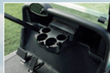
Ergonomicky umístěné držáky nápojů, přepínač jízdy vpřed a vzad integrovaný do spínací křížky, automatická parkovací brzda.