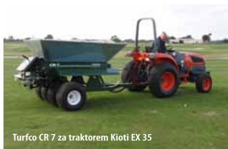
Turfco CR 7 za traktorem Kioti EX 35

Pouze pískovače Turfco rozhazují materiál jen do úrovně zadních kol. Tím nedochází k překrývání vrstev po stranách pískovače. Díky tomu s nižší spotřebou materiálu zapískujete stejnou plochu naprosto rovnoměrnou vrstvou. Šetříte peníze na pořízení písku, a zároveň se vyhnete problémům s nerovnoměrnou vrstvou písku, které se projeví v budoucnu.