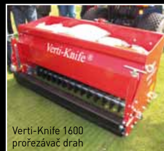
Verti-Knife 1600 prořezávač drah