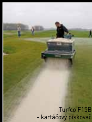
Turfco F15B – kartáčový pískovač