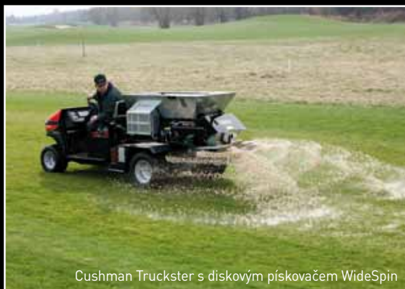
Cushman Truckster s diskovým pískovačem WideSpin