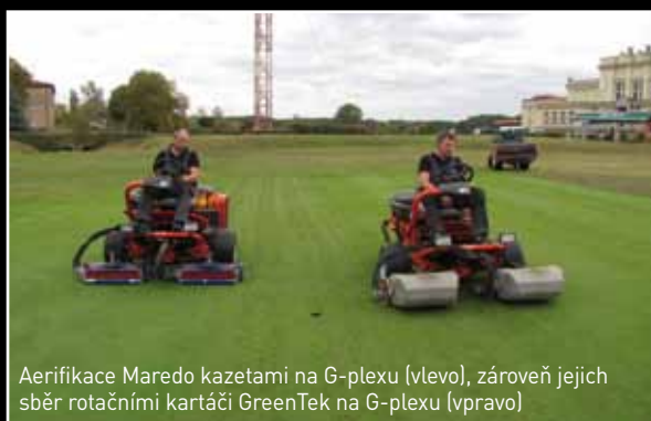
Aerifikace Maredo kazetami na G-plexu (vlevo), zároveň jejich sběr rotačními kartáči GreenTek na G-plexu (vpravo)