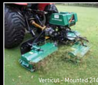
Verticut - Mounted 214