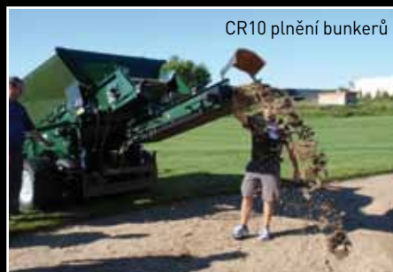
CR10 plnění bunkerů