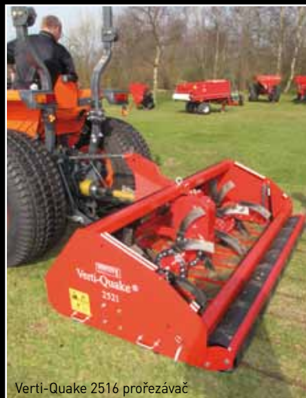
Verti-Quake 2516 prořezávač