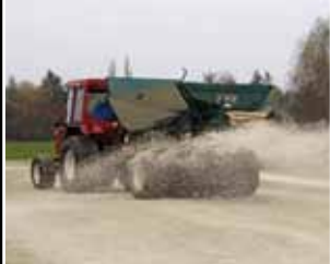
Turfco CR10 – diskový pískovač – heavy top-dressing