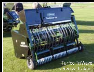
Turfco TriWave verze za traktor