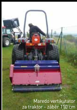
Maredo vertikutátor za traktor - záběr 110 cm