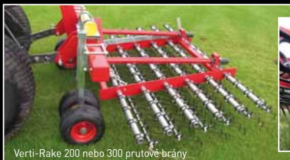
Verti-Rake 200 nebo 300 prutové brány