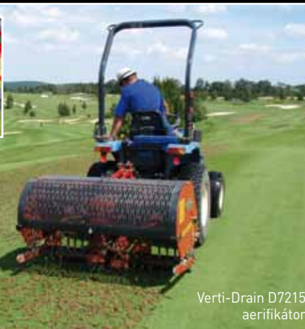
Verti-Drain D7215 aerifikátor