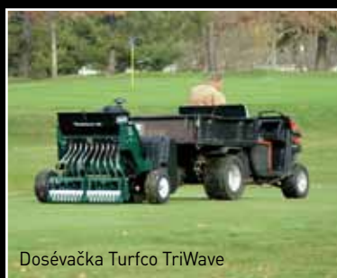
Dosévačka Turfco TriWave