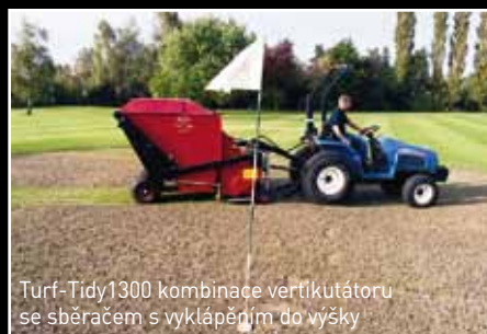
Turf-Tidy1300 kombinace vertikutátoru se sběračem s vyklápěním do výšky