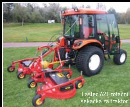
Lastec 621 rotační sekačka za traktor