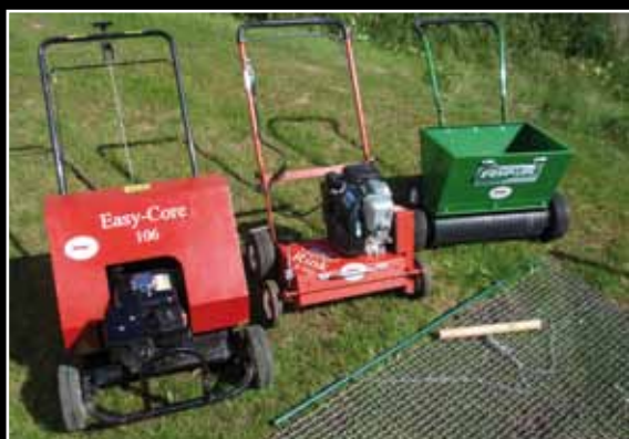
Aerifikátor Easy Core 106, vertikutátor Rink S510, pískovač Rink ET240 a tažená síť dragmat pro regeneraci menších ploch