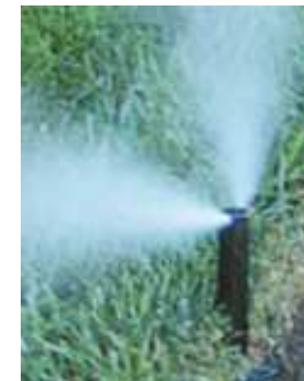
AMOS – PDP 15