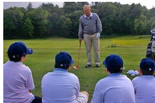
In England this October, Jack Nicklaus explains this more forgiving version of the game, called SNAG.